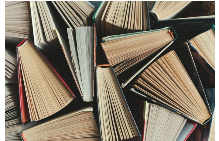
Gebrek aan kennis